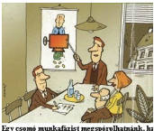
Egy csomó munkafizist megperrelhatsz, az ezzel az idétes szerkezettel kivéded az alkalmasságokból eszélésnek a pénzt.

KÖVETELJÜK, hogy azoknak akik nem szabad akaratukból banki ügyfelek, a megkeresett 1.000.-forintból 1.000.- forinthez juthassanak hozzá és ne kelljen azért fizetni, hogy a saját fizetésükhöz hozzájussanak!