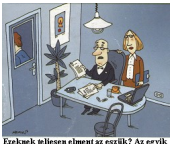
Ezeknek teljeseen elment az orruk? Az egyik törzességes fizetést akar, a másik meg bejelenti munkahelyet. His teljeseen önkre akarták venni a céget?!

A vicc az, hogy ma ez egyáltalán nem vicc!